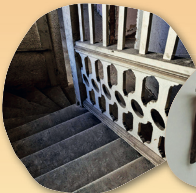
Lehrer-Meyer-Haus, wo Kaspar Hauser seine letzten Lebensjahre verbrachte

Wenn Sie sich angesprochen fühlen, Ihr Interesse geweckt ist, Sie helfen oder spenden möchten, rufen Sie uns doch an. Gemeinsam finden wir individuelle Möglichkeiten, da Sie sich unterstützend einbringen können – wenn Sie das wollen.