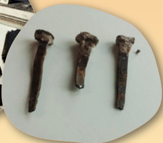
Handgeschmiedete Nägel (200 bis 300 Jahre alt) sind ein Teil der Bausteine, die man für eine Spende, erwerben kann